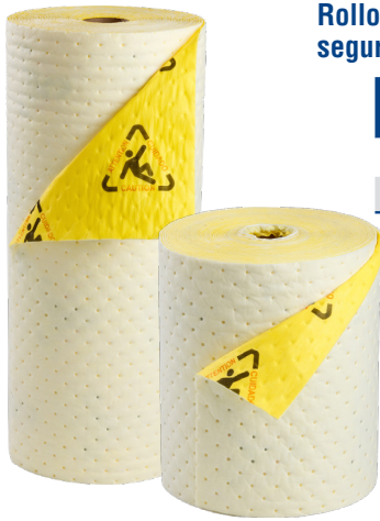
Rollos de absorbencia química y seguridad para alto tráfico