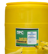
Kit de 55 galones para derrames