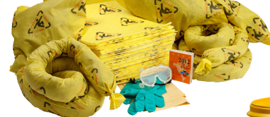
Kit de 95 galones para derrames