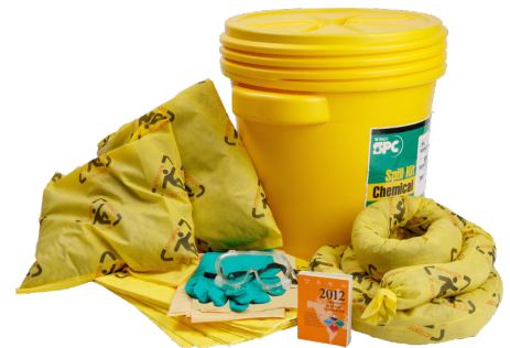
Kit de 20 galones para derrames