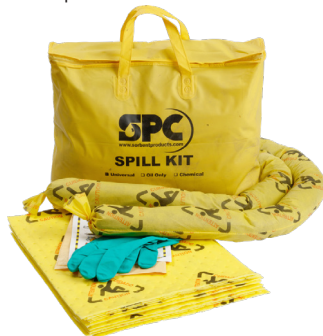
Kit para derrames económico