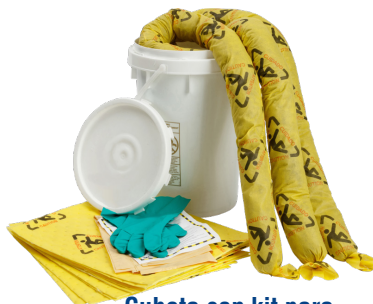
Cubeta con kit para derrames